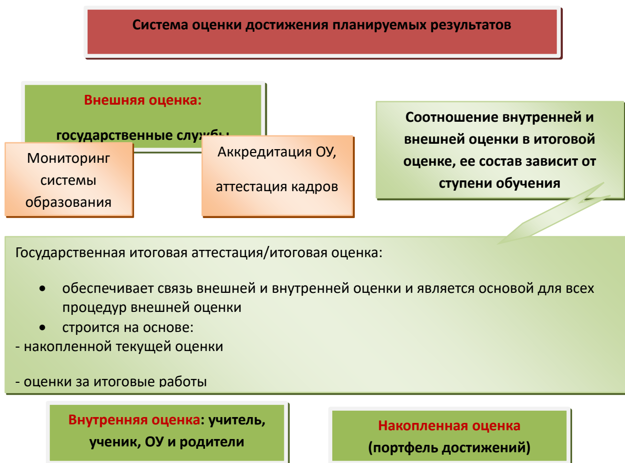
Рис. 2. Система оценки достижения планируемых результатов

В соответствии с ФГОС ООО основным объектом системы оценки результатов образования, её содержательной и критериальной базой выступают требования Стандарта , которые конкретизируются в планируемых результатах освоения учащимися основной образовательной программы основного общего образования.