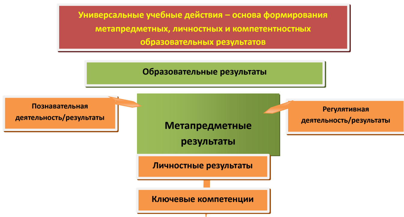
Рис. 3. Система оценки образовательных результатов

Интерпретация результатов оценки ведётся на основе контекстной информации об условиях и особенностях деятельности субъектов образовательного процесса. В частности, итоговая оценка учащихся определяется с учётом их стартового уровня и динамики образовательных достижений.